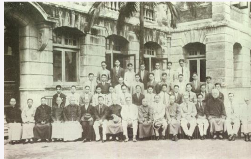
1930 年香港大學中文學會成立師生合影