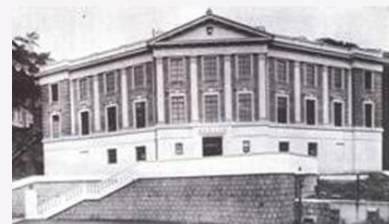
香港大學馮平山圖書館