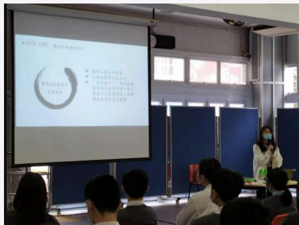
徐碧愉（五年級）擔任 香港大學青藜教育小組幹事 到本地中學介紹中國農村教育