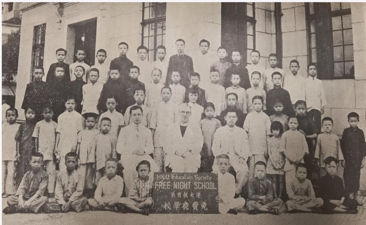
1938年，香港大學教育學會師生為失學兒童籌辦免費夜學校。