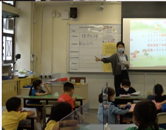
2021年，我們的同學在小學實習教學。