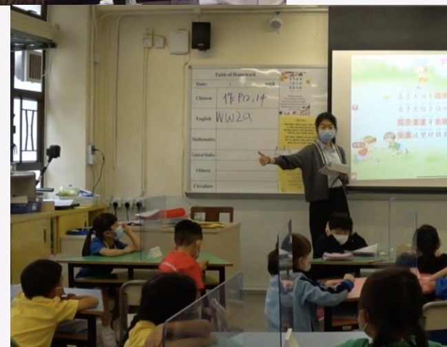
2021年，我們的同學在小學實習教學。