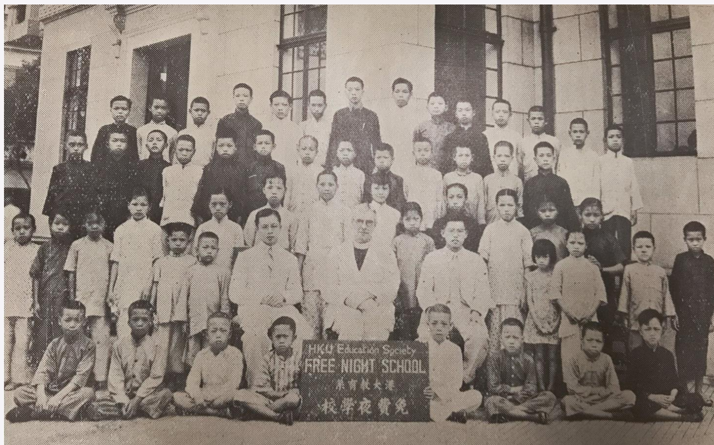
1938年，香港大學教育學會師生為失學兒童籌辦免費夜學校。