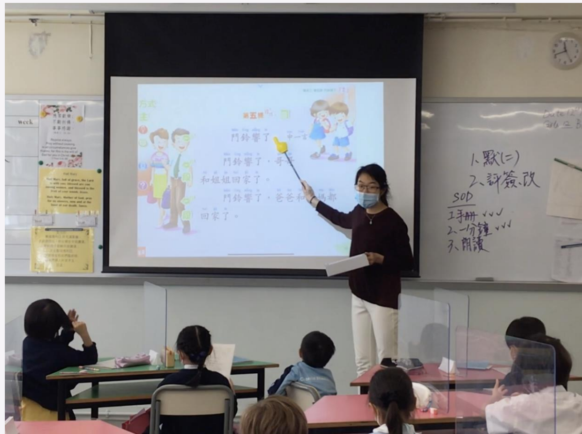
2020年，香港大學中文教育四年級同學在小學實習教學。