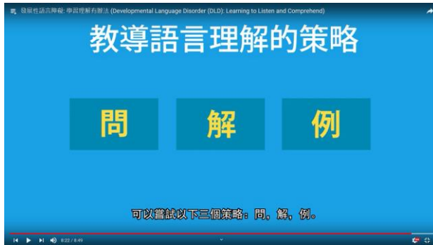
「問」、「解」、「例」三大策略有助改善發展性語言障礙兒童的語言理解能力。 [發展性語言障礙：學習理解有辦法 (Developmental Language Disorder (DLD): Learning to Listen and Comprehend) - 8:22]